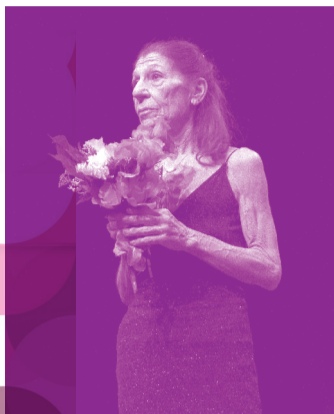
JÉAN-CHRISTOPHE BLETON © LAURENT PAILLIER