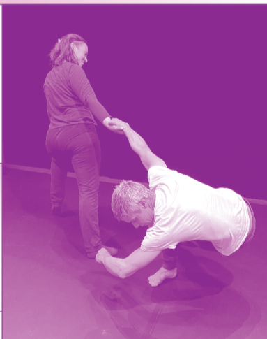
ATELIER CHORÉGRAPHIQUE