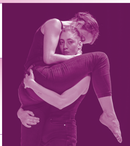
MICHÈLE MURRAY