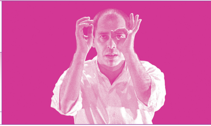
BERNARD GLANDIER