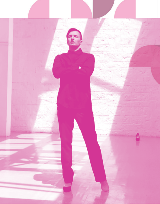
EMMANUEL EGGERMONT