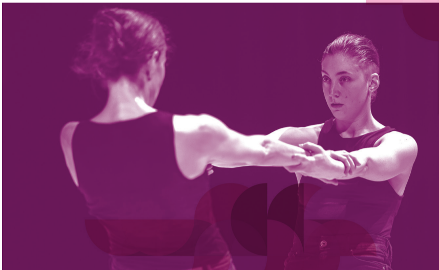
MICHÈLE MURRAY