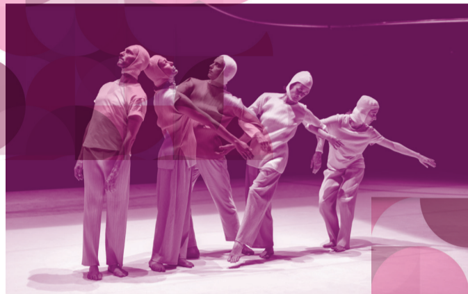
DANIEL LARRIEU